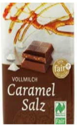
Vollmilch Caramel Salz 40g Tafel 1,00 €