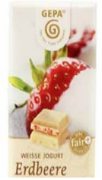
Weiße Erdbeere 40g Tafel 1,00 €