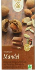
Vollmilch - Mandel 100g Tafel 2,00 €