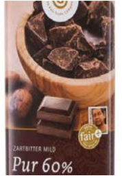
Zartbitter mild pur 100g Tafel 1,80 €