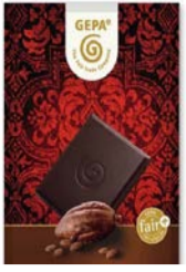
Grand Noir Edelbitter 100g Tafel 2,30 €