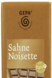
Sahne Noisette 100g Tafel 1,50 €