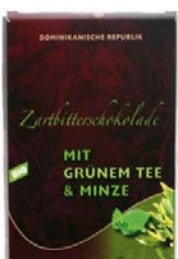
Grüner Tee & Minze 100g Tafel 2,50 €