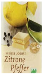
Weiße Zitrone Pfeffer 40g Tafel 1,00 €