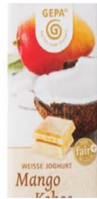
Weiße Mango Kokos 40g Tafel 1,00 €