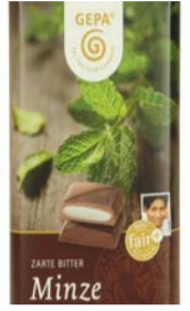
Zarte Bitter Minze 100g Tafel 2,00 €