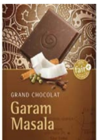
Garam Massala 100g Tafel 2,50 €