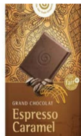
Espresso Caramel 100g Tafel 2,50 €