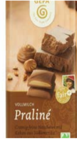
Praliné 100g Tafel 2,00 €