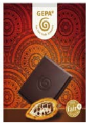
Grand Noir Zarte Bitter 100g Tafel 2,30 €