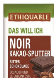
Noir mit Kakaosplittern 100g Tafel 2,30 €