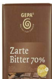
Zarte Bitter 100g Tafel 1,50 €