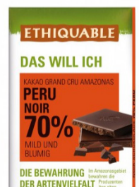
Noir Schokolade 70 % 100g Tafel 2,30 €