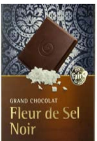
Fleur de Sel Noir 100g Tafel 2,50 €