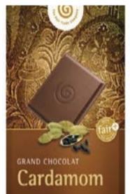
Cardamom 100g Tafel 2,50 €