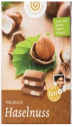
Vollmilch - Haselnuss 100g Tafel 2,00 €