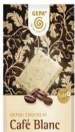
Café Blanc 100g Tafel 2,50 €