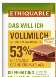
Vollmilch 53 % 100g Tafel 2,30 €