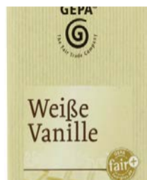
Weisse Vanille 100g Tafel 1,50 €