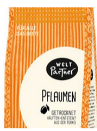
Pflaumen 200g Pckg. 3,90 €