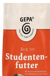
Studentenfutter 250g Beutel 5,50 €