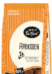
Aprikosen 250g Pckg. 4,90 €