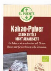
Kakao - Pulver 250g Karton 3,90 €