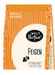
Feigen 250g Pckg. 4,00 €