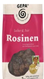
Rosinen (ungeschwefelt) 250g Beutel 2,70 €