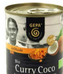
Curry Coco 200ml Dose 2,50 €