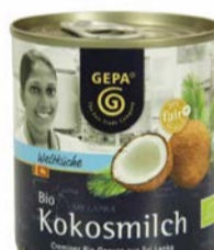
Kokosmilch 200ml Dose 1,50 €