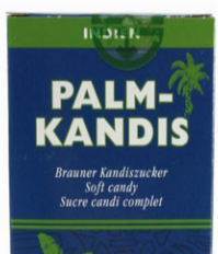
Palmzucker Kandis 200g Karton 3,20 €