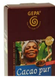
Cacao Pur Afrika 250g Karton 4,80 €