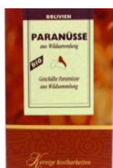
Paranüsse geschält 250g Karton 6,90 €