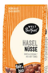
Haselnüsse 200g Pckg. 5,30 €