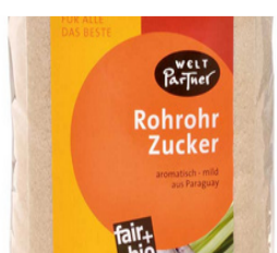
Rohrohrzucker 1kg Karton 4,70 €