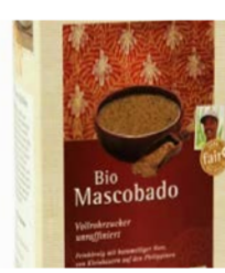
Mascobado Vollrohrzucker 1kg Karton 6,30 €