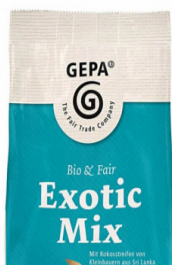
Exotic Mix 100g Beutel 3,70 €