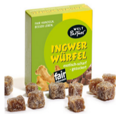
Ingwerwürfel 25g Karton 1,30 €