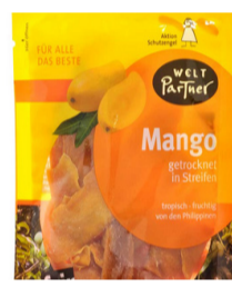
getrocknete Mangos gesüßt 100g Beutel 3,30 €