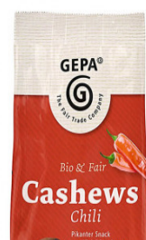
Cashews Chili 100g Beutel 3,50 €