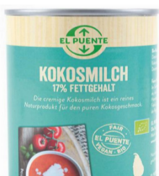
Kokosmilch 400 ml Dose 2,90 €