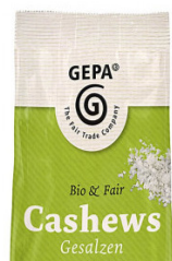
Cashews Salz 100g Beutel 3,50 €