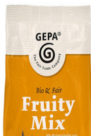
Fruity Mix 100g Beutel 3,70 €