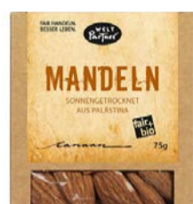
Mandeln 75g Karton 3,00 €