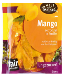
getrocknete Mangos ungesüßt 100g Beutel 4,00 €