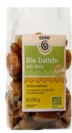
Datteln mit Stein 250g Beutel 3,00 €