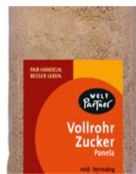
Panella Vollrohrzucker 500g Beutel 2,80 €