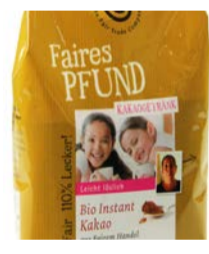
Das faire Pfund Kakao 500g Beutel 5,30 €