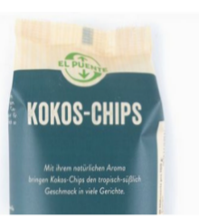
Kokoschips 80g Karton 2,90 €