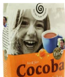
Cocoba Instantkakao 400g Beutel 4,80 €